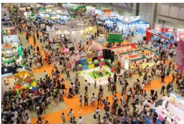
【東京おもちゃショー2016】

皆様におかれましては是非、出展をご検討いただき、今後も大きく飛躍し続ける東京おもちゃショー「キッズライフゾーン」にご参画下さいますよう、お願い申し上げます。