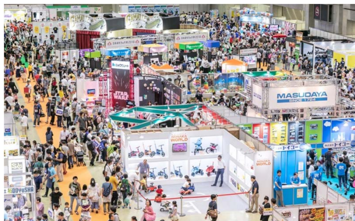
【東京おもちゃショー2018】

皆様におかれましては是非、出展をご検討いただき、今後も大きく飛躍し続ける東京おもちゃショー「キッズライフゾーン」にご参画下さいますよう、お願い申し上げます。