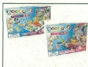
Bindeez Themed Gift Box - Pet Shop/Fairy Land