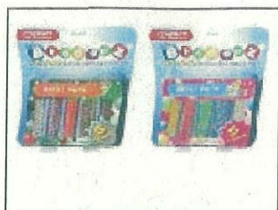
Bindeez Refill Pack S2 (Primary Colours)