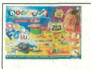
Bindeez Deluxe Box