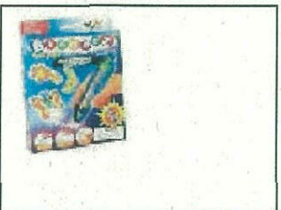
Bindeez Starter Pack - Glow in the Dark