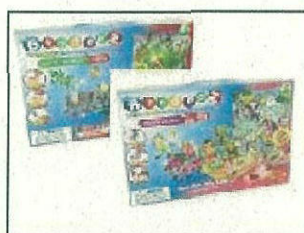
Bindeez Themed Gift Box - Jungle World/Pony World