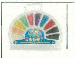
Bindeez Ultimate Bead pack LGE S1