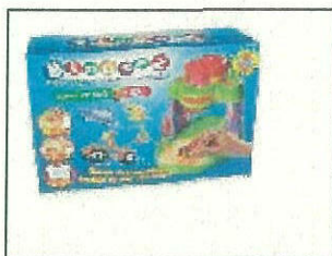
Bindeez Super Studio