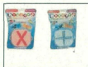
Bindeez Tray & Spray Pack