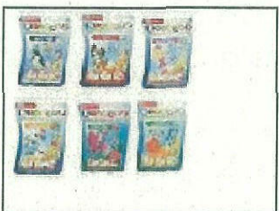
Bindeez Themed Refill Pack S2