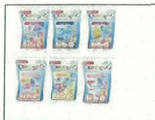
Bindeez Themed Refill Pack S1