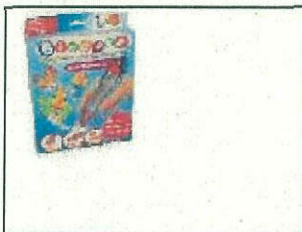
Bindeez Starter Pack