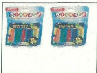
Bindeez Refill Pack S1