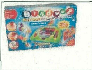
Bindeez Activity Pack