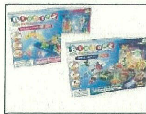
Bindeez Themed Gift Box - Ocean World/Space World