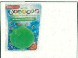
Bindeez Container Pack