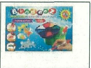
Bindeez Portable Pack