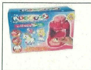
Bindeez Super Studio - Princess (Pink)