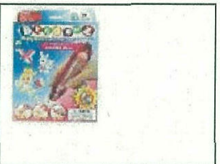
Bindeez Starter Pack - Princess (Pink)